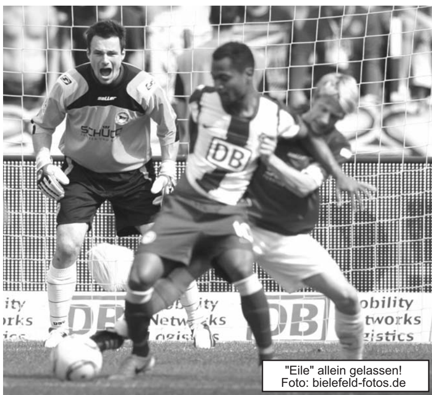
"Eile" allein gelassen!

...null Punkte. Das ist die Zwischenbilanz des DSC in dieser noch jungen Saison. Mit dem FC Ingolstadt betritt heute ein Gegner den heimischen Rasen, der die gleiche Bilanz aufweist. Tabellarisch also ein Duell auf Augenhöhe. Alles andere wird das heutige Spiel zeigen. Bei einer weiteren Niederlage müsste man sich wohl oder übel die Frage stellen: Wenn wir gegen Ingolstadt nicht gewinnen, gegen wen dann? Damit wir erst gar nicht in diese Situation kommen, muss heute alles gegeben werden, sowohl auf dem Rasen als auch auf den Rängen!