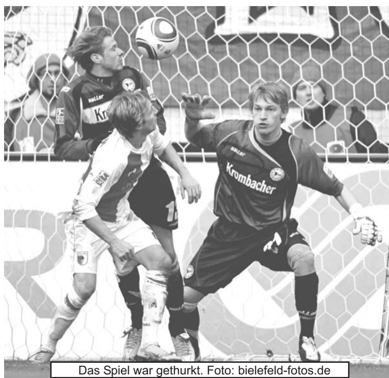
Das Spiel war gethrurt.

realcolor Druck & Offsetdruck www.realcolor.de