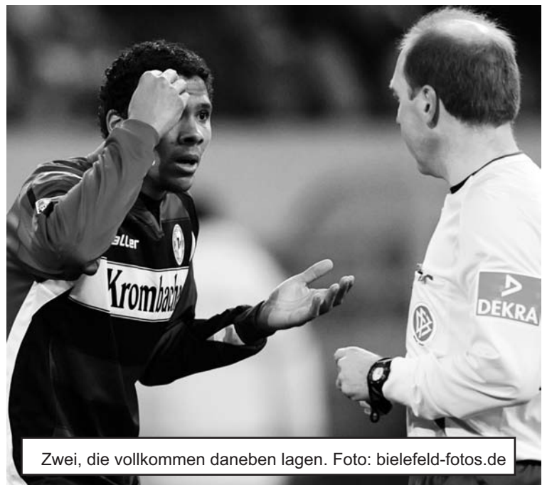
Zwei, die vollkommen daneben lagen.

Das urälteste Turnier des Fanprojektes geht in die nächste Runde. Am Samstag, 19. Dezember, werden ab 17 Uhr die ersten Partien angepfiffen. Es sind noch Teilnehmerplätze frei! Das Ende fällt zusammen mit dem Startschuss der diesjährigen SWBD-Weihnachtsfeier. Diese unverwüstliche Feier wird dieses Jahr in der Wirtschafft „Linie 4“ ausgerichtet; es wird kein Eintritt erhoben, es winken moderate Getränkepreise, und das alles ab 19.30 Uhr.