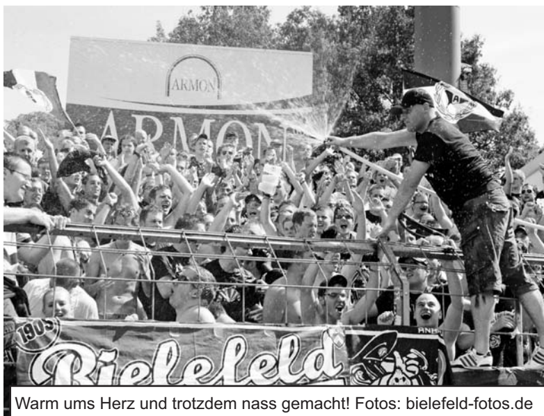
Warm ums Herz und trotzdem nass gemacht!

Hier wurde von den meisten, ob der extremen Hitze, erstmal einer der rar gesäten Plätze im Schatten aufgesucht, um den Spielbeginn abzuwarten. Über den, ja leider nur für 80 Minuten erfolgreichen Verlauf des Spieles soll hier dann auch der Mantel des Schweigens ausgebreitet werden. Ein Highlight war aber die erfrischende Wasserschlacht in der Halbzeitpause, für die die Koblenzer Stadionleitung eigens einen Schlauch zur Verfügung stellte - Danke dafür! Nach dem Spiel ging es dann auch schnell zurück zu unserem, inzwischen zum Sauna-auf-Rädern mutierten, Bus und nachdem die Motorradeskorte eingetroffen war, verließ man die Stadt auch so schnell und problemlos wie man sie betreten hatte. Die Rückfahrt verkürzten wir uns durch Filmgucken und das Verteilen der phänomenalen Quizpreise, bis wir am Abend erschöpft ob des doch recht langen Tages wieder an der heimischen Alm ankamen.