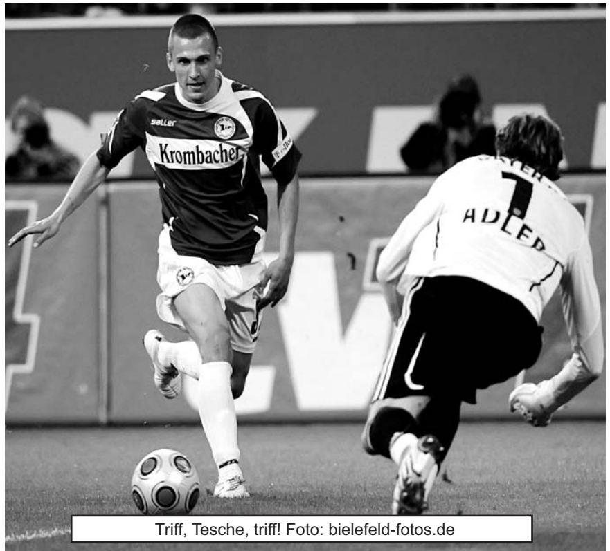
Triff, Tesche, triff!

HOPPla: Bei einem Gastspiel der TSG Hoffenheim stolpert man ungeweigerlich über das Phänomen Hopp. Aber über Sinn und Unsinn des Mäzen-Modells philosophieren? Nein. In der Vergangenheit ist genug gesagt und geschrieben worden. Und ein jeder Fan konnte sich seine eigene Meinung bilden. Wir konzentrieren uns heute auf drei Punkte gegen den Abstieg. Diesmal gibt's keine Ausreden. Und auch keine Schönrederei. Aber wem sagen wir das, Herr Frontzeck? Ein Willkommensgruß all denen, die dem Herbstmeister die Daumen drücken. Immerhin 15, so schätzen wir mal, dürften das sein. Hoffentlich werden die Bratwurst- und Getränke-Vorräte in eurem Sektor nicht knapp. Damit aber eins klar ist: Wir bringen euch keine Leckereien 'rüber. Nicht, dass wir keine gastfreundlichen Zeitgenossen wären. Im Gegenteil. Aber wir haben heute Wichtigeres vor: Singen, trommeln, unser Team nach vorne peitschen. Wegen der Wurst, da fragt doch mal den Dietmar. Die Punkte allerdings, die bekommen heute weder Hopp noch seine Huldiger.