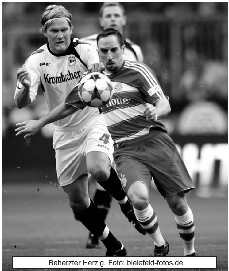
Beherrzter Herzig.

An dieser Stelle einmal mehr ein kleiner Griff in die kunterbunte Archiv-Kiste. Wir schreiben den 24. September 2005. Einst gastierte der heutige Gegner Borussia Mönchengladbach auf der Alm. Die Fohlen gewannen 2:0 und beendeten damit eine Durststrecke von eineinhalb Jahren ohne Auswärtssieg. Eineinhalb Jahre kollektives Versagen in der Fremde. Kommt uns irgendwie bekannt vor. Nun denn, zurück zur geschichtsträchtigen Partie. Denn beim VfL war der Jubel nach dem Alm-Sturm in der noch jungen Phase der Saison 2005/2006 groß, an dessen Ende sowohl die Borussia als auch unsere Blauen die Klasse hielten. Gladbach auf Rang zehn, der DSC auf 13. Drei Jahre danach ist alles wie immer: Gladbach lechzt nach einem Sieg in der Fremde und hat in dieser Spielzeit noch keinen Auswärtsauftritt erfolgreich gestalten können, genau wie der DSC. Unterschied: WIR spielen diesmal daheim. Und WIR lassen diesmal den Fohlen keinen Platz, sich in der Fremde, in Ostwestfalen breitzumachen. Es ist uns (fast) schnuppe, welche Bilanz die Borussia am Ende der Saison aufweist. Hauptsache, dort steht nicht Schwarz auf Weiß geschrieben: Einziger Auswärtssieg von Borussia Mönchengladbach am 8. November 2008 in Bielefeld. Auf geht's ihr Blauen!